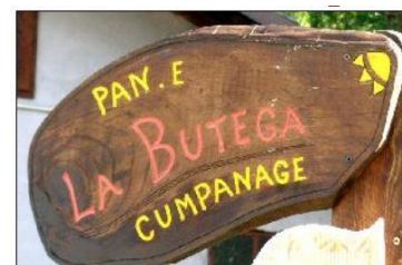
CELLE MACRA - Borgata Chiesa n.8