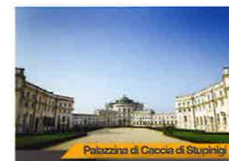
Palazzina di Goccia di Stupinigi