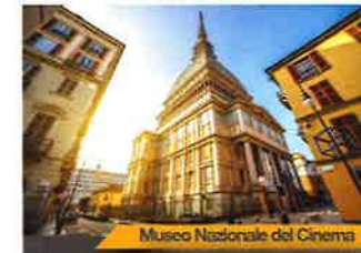
Museo Nazionale del Cinema