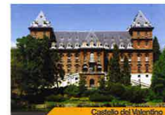
Castello del Valentino